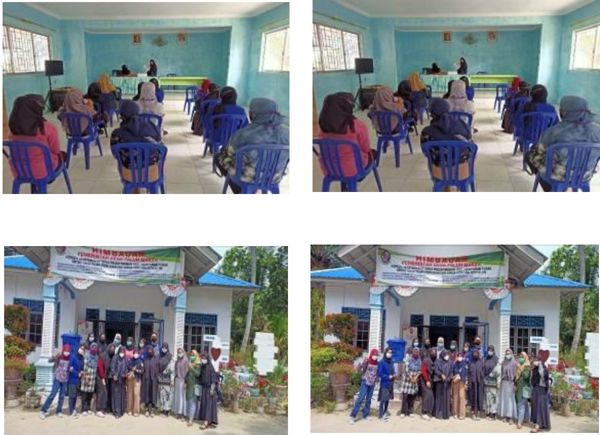
Gambar 2. Dokumentasi Pelaksanaan Kegiatan