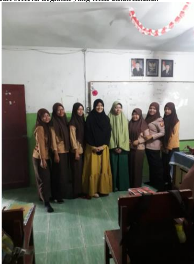
Gambar 2. Kegiatan Foto Bersama dengan Peserta

Setelah semua kegiatan terlaksana, tim pelaksana PKM menyusun laporan akhir yang berupa dokumentasi dari seluruh kegiatan yang telah dilaksanakan.