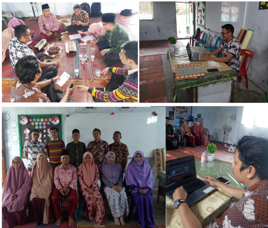
Gambar 2. Foto Pelaksanaan Kegiatan Masyarakat

Pemberian materi, rapat dan foto bersama guru dan pegawai dan kepala sekolah oleh Tim Pengabdian masyarakat dan setelah pemaparan dilanjutkan dengan Pratikum mengenai penggunaan aplikasi absensi guru berbasis sms gateway.