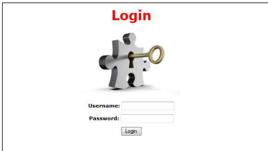
Gambar 3 Prototype Login