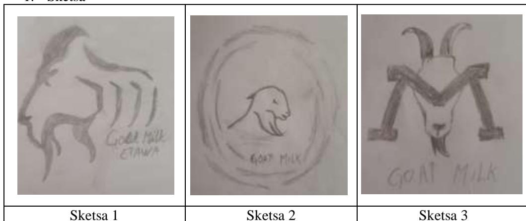
Gambar.2. Sketsa Logo