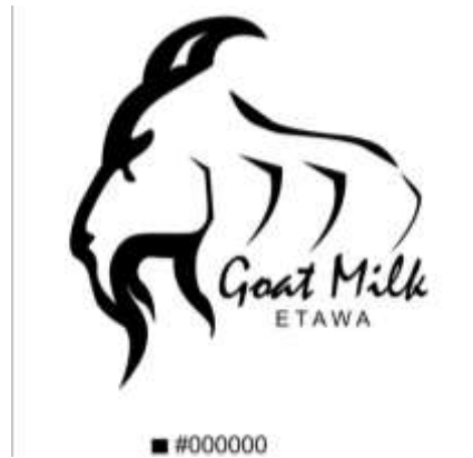
Gambar.6. Desain Terpilih