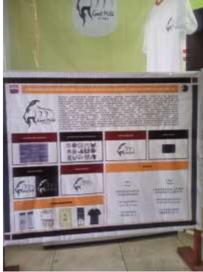
Gambar.9. Poster Proses Perancangan