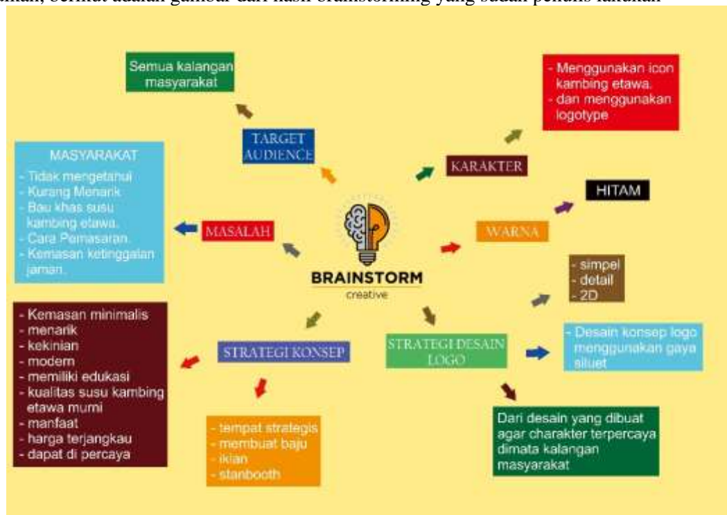
Gambar 1. Brainstorming

Penulis menggunakan metode brainstorming untuk mencari gagasan-gagasan penting untuk mencari ide kreatif yang muncul untuk membuat suatu visual branding dari data-data yang sudah dikumpulkan, berikut adalah gambar dari hasil brainstorming yang sudah penulis lakukan